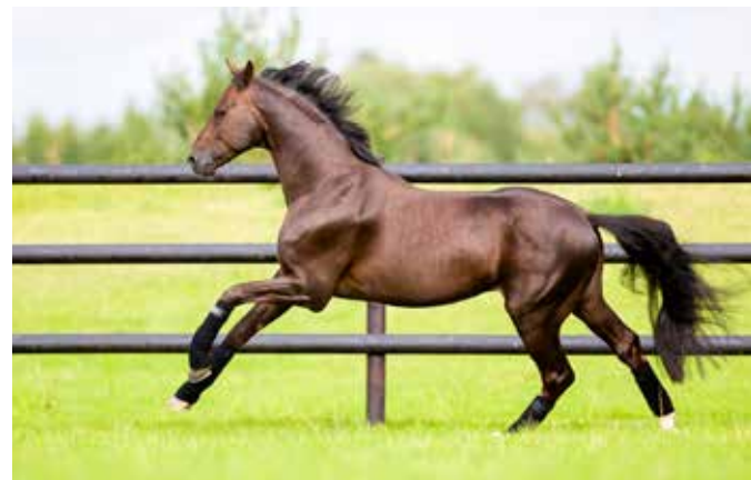
Besonders Hengste bekommen häufig zu wenig freie Bewegung, weil sie nicht in die Herde integriert werden können. Aber auch für sie müssen Freiflächen zur Verfügung stehen.

bei Jungpferden zur gesunden Entwicklung von Bewegungsapparat und Herz-Kreislauf-System bei. „Das Aufwachsen in Gruppen ist Voraussetzung für die Entwicklung eines gesunden Sozialverhaltens“, fügt Prof. Dr. Schnitzer hinzu.