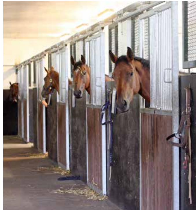
Wenn Pferde in Einzelboxen gehalten werden, brauchen sie mindestens einen Artgenossen in der Nähe, den sie sehen, hören und riechen können. Einzelhaltung ohne Kontakt zu Artgenossen verstößt gegen die Leitlinien.