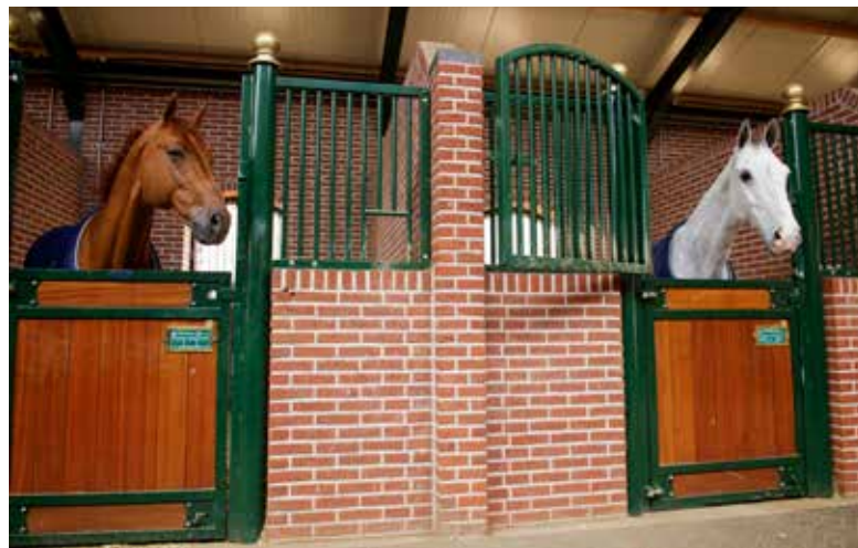
Mögen Box und Stalltrakt nach so schön sein, Pferde in Einzelhaltung brauchen täglich freie Bewegung auf wetterfesten Ausläufen oder auf der Weide.

Die Tatsache, dass ein Pferd in Gruppenhaltung lebt, entbindet den Pferdebesitzer nicht von der Verantwort-