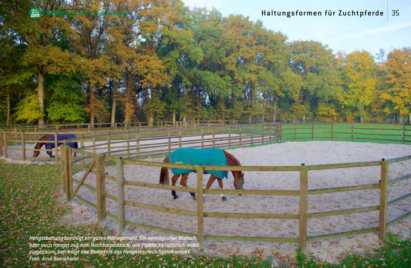
Hengsthaltung benötigt ein gutes Management. Ein verträglicher Wallach oder auch Hengst auf dem Nachbarpaddock, alle Paddocks natürlich stabil eingezäunt, befriedigt das Bedürfnis des Hengstes nach Sozialkontakt.

Bewegung garantiert sind. Das ist jedoch die absolute Untergrenze. Da bei Jungpferden und Zuchtstuten in der Regel nur freie Bewegung möglich ist, müssen sie laut Leitlinien so viel Zeit wie möglich auf der Weide und/oder im Auslauf verbringen. Am besten gemeinsam mit Artgenossen. Das spielt insbesondere für heranwachsende Pferde eine wichtige Rolle. Nicht nur dass sich ihr Bewegungsapparat und Herz-Kreislauf-System dann bestmöglich und leistungsfähig entwickelt. In der Gruppe lernen sie zudem ein gesundes Sozialverhalten. Und das ist der Grundstein für ein entspanntes Pferdeleben.