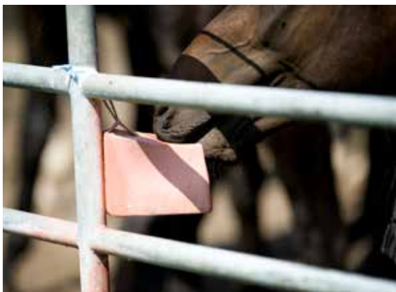
Hat eine Boden- oder Futteruntersuchung einen zu geringen Nährstoffgehalt ergeben, kann ein Mineral-Leckstein oder eine Mineral-Leckschale auf der Weide einem Vitamin- und Mineralmangel vorbeugen.

Ein Maulkorb als Fressbremse ist sinnvoll bei Pferden, die zu viel Futter aufnehmen und das satte Grün nicht vertragen. Aber er ist mit Vorsicht einzusetzen.