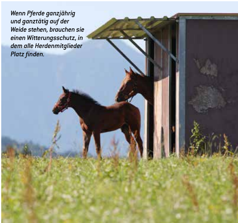
Wenn Pferde ganzjährig und ganztätig auf der Weide stehen, brauchen sie einen Witterungsschutz, in dem alle Herdenmitglieder Platz finden.