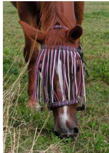
Eine Fliegenmaske, entweder als Franzenband oder fest verschlossen, hält zumindest einige Plagegeister fern. Pferde, die mit Sommerkezern belastet sind, sollten entweder nur nachts auf die Wiese oder mit einer Ekzmerdecke geschützt werden.

zu warm wird. Spezielle Bremsenfallen, die neben Weide oder Auslauf aufgestellt werden, sollen Stechinssekten anlocken und den Bestand verringern.